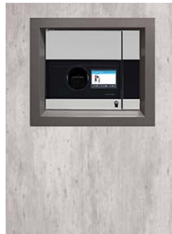
TOMRA T70 Dual